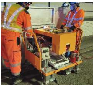
①赤外線ヒーターをセット