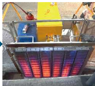
②3分間タイル表面を加熱