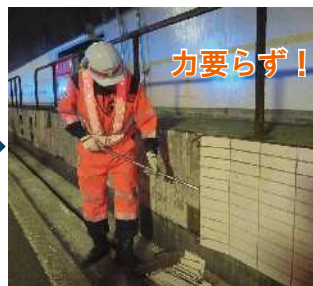
③ケレン棒をタイルの背面に差込むとタイルが簡単に剥がれ落ちます