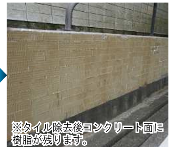
④落下したタイルを除去して 作業完了