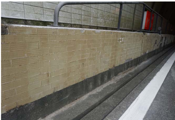
④後は落ちたタイルを拾い集めて撤去完了 注) タイルを剥がした後は、コンクリート面に樹脂が残ります。