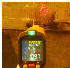
コンクリート受熱温度