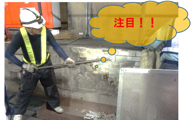
③ケレン棒（ヘラ）をタイルの背面に差込むとタイルが パラパラ っと剥がれ落ちます。