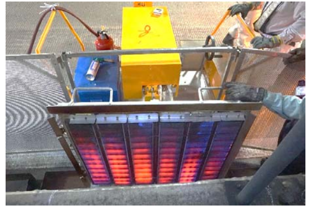
② 2~3分間タイルの表面を熱します。