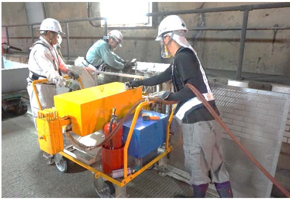
① 遠赤外線ヒーターをセット