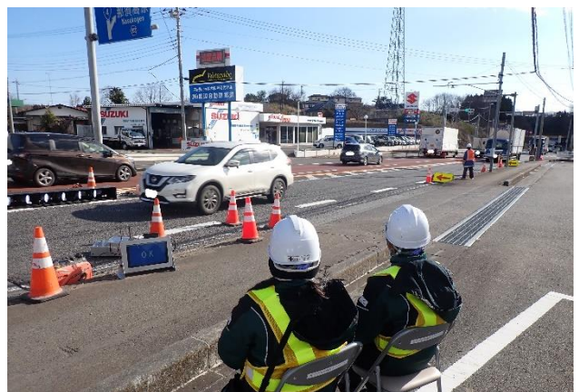
冬用タイヤ装着率調査（第3回）実施状況

- 冬用タイヤ自動判別システム - NETIS 登録番号 SK-190003-A https://www.w-e-shikoku.co.jp/wp-content/uploads/2021/07/wintertire-1.pdf 西日本高速道路エンジニアリング 四国株式会社